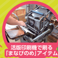
活版印刷機で刷る「まなびのめ」アイテム