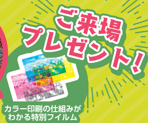
カラー印刷の仕組みがわかる特別フィルム